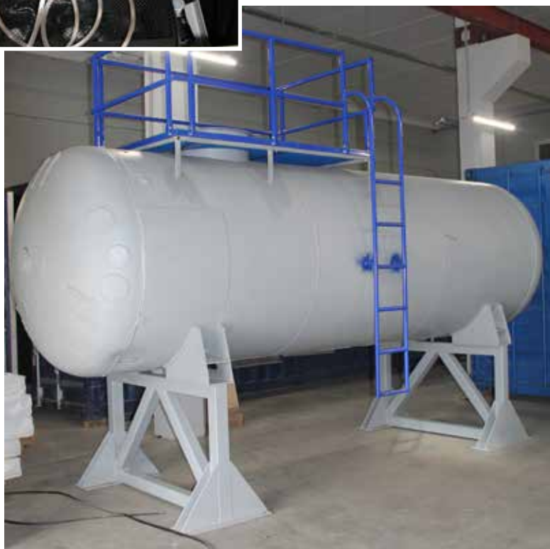
Учебно-тренажерный моделирующий комплекс "Цистерна", предназначенный для отработки навыков работы при ликвидации последствий аварий с протечками железнодорожных и автомобильных цистерн