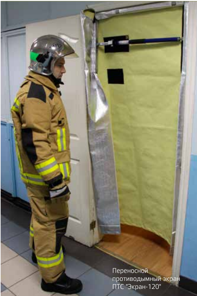
Переносной противодымный экран ПТС «Экран-120»