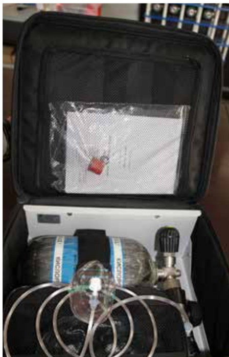
Укладка респираторной поддержки для оказания первой помощи пострадавшему на месте пожара

Удивительно, но при всей занятости сотрудники ОАО «ПТС» находят время для того, чтобы перевести дух и хоть несколько минут заняться чем-то для души. Кто-то, к примеру, репетирует в заводском вокально-инструментальном ансамбле. Кто-то увлекся облагораживанием территории завода, да так, что получил в этом году грамоту от главы Подольского муниципального района за победу в конкурсе «Цветы Подолья» в номинации «Лучшая территория предприятия». Ну и, конечно, главная заводская фишка — уникальная коллекция какту-