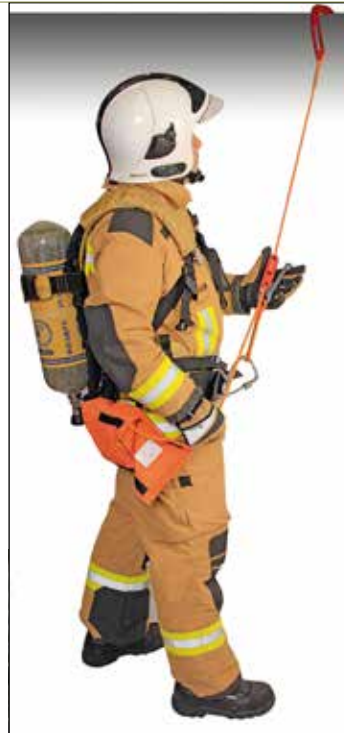
Устройство канатно-спусковое индивидуальное пожарное ручное «ПТС-Вертикаль»